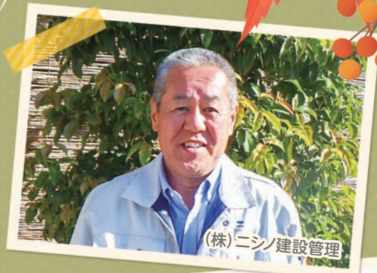
(株)ニシノ建設管理