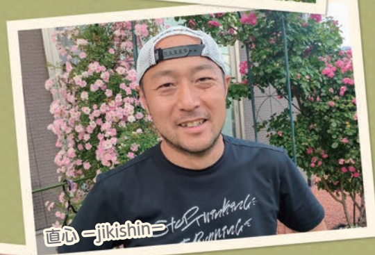
直心 = jkshin