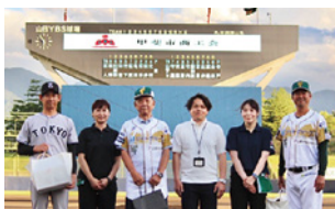
桑商品に込めた甲斐市の魅力を贈呈