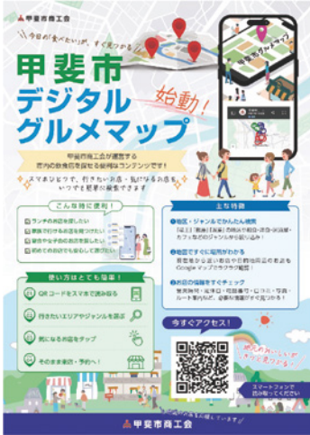
グルメマップチラシ

デジタルグルメマップは、甲斐市商工会のホームページに掲載しているバナーから簡単にアクセスできます。使い方はとても簡単で、行きたいエリアやジャンルを選択し、気