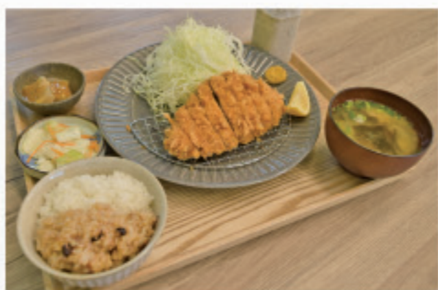
くるみ自慢の上ロースカツ定食

店名の通り、とんかつを中心とした定食メニューが基本で、サクサクの衣とジューシーな肉質が特徴です。