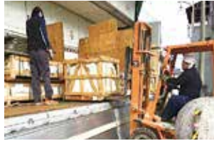
石材荷下ろし作業の様子

私は大学時代にCAD(コンピュータ支援設計)について学び、卒業後、父親が経営する石材店に就職しました。父親からは、石材切削機等の機械の動かし方、また、現場作業やお客様との接し方までを時には厳しい指導のもとで学んできました。