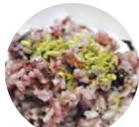
桑の実ごはん 甲斐市商工会女性部