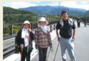
余暇には、市内イベントに参加し家族で健康づくり

なあり方のアクションプランやキャッシュフロー計算書の作成に取り組んだ。 また、業界の中核企業となるべく長期的な視野に立ち、主業のほか、公園のブランコ・滑り台等の遊具、公園環境施設の設計など施工ジャンルを広げるなど事業展開を図るとともに、従業員に数々の資格取得を奨励するなど、従業員教育にも積極的に取り組んでいる。