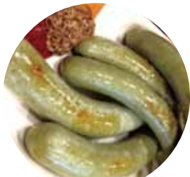
桑の葉ソーセージ ITKプランニング