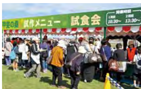
10月23日 試食会場の様子

去る10月23日に開催された「甲斐市わくわくフェスタ」(日本航空学園)会場において桑の葉を活用した新商品発表試食会を行った。 この試食会は、本年度国の補助金を活用し、甲斐の桑のさらなる活用と販路開拓を図り、甲斐ブランドとしての定着推進を目指す事業の一環として実施したもので、地域の飲食店・和洋菓子店・食品製造者と連携して開発した商品を発表し、試食を行った。 「桑の実ジャム」、「桑の葉パウダー」などを用いた新商品を、当日来場した多くの方に試食してもらいアンケートに答えてもらった。 ご協力いただいたアンケートを今後の商品開発に役立たせてもらい、「桑」を甲斐市の特産品として普及させ、地域活性化につなげていく。