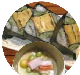
桑の葉パウダーの四海巻きと 茶碗蒸し 魚竹寿司