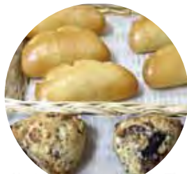
マルベリースコーンと マルベリークリームパン パンのお家