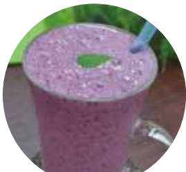
マルベリーとバナナの スムージー Full moon