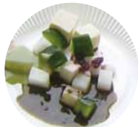
ドレッシング3種 やまなし健康・栄養サポートセンター