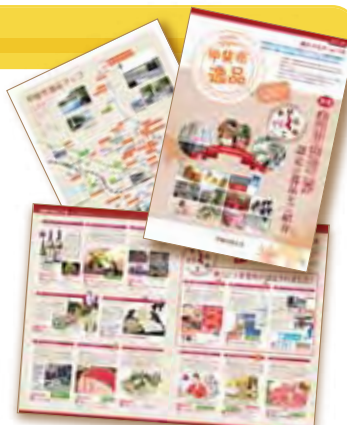
甲斐市逸品商カタログ昨年見本

地元のお店の真心を込めた魅力ある「逸品」が勢ぞろい。今年も甲斐市のお店自慢の商品やサービス・技術などを紹介する「甲斐市逸品商カタログ vol.19」を11月後半に発行（新聞折込）しますので、楽しみにしてください。