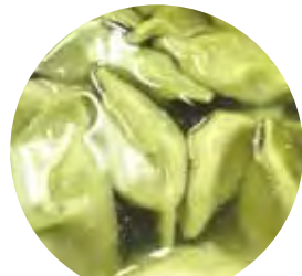
桑の葉水餃子 吉祥楼

甲斐市商工会 〒400-0115 甲斐市篠原2710-1 Tel 055-276-2385 Fax 055-279-0187