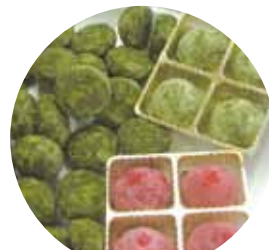
桑の葉とフランボワーズの スノーボール ぎんが工房