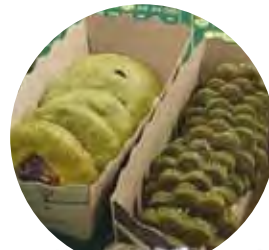
おからと桑のクッキー (株)山梨福祉総研