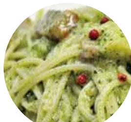
桑の葉パスタソース The CAFE L.D.K