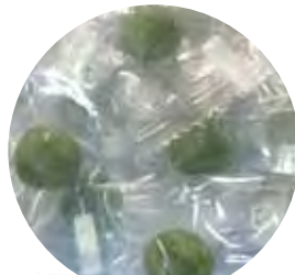
桑の葉茶キャンディー 小笠園