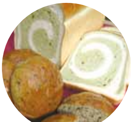
桑の葉食パンと 桑の葉丹波の豆パン 平林製パン